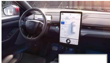
Ford SYNC 4A