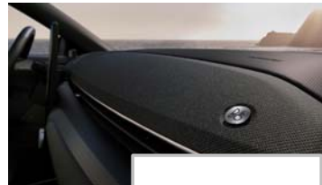
B&O zvočni sistem