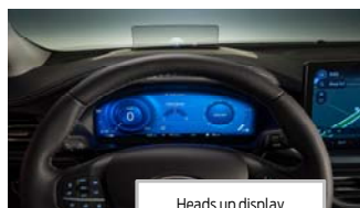
Heads up display