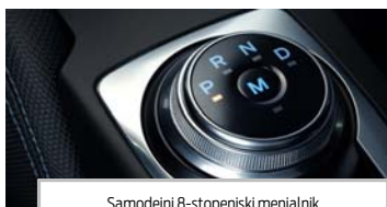
Sarnodejni 8-stopenjski menjalnik