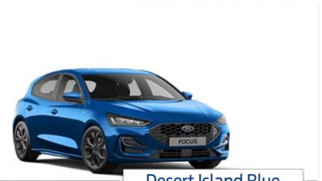
Desert Island Blue